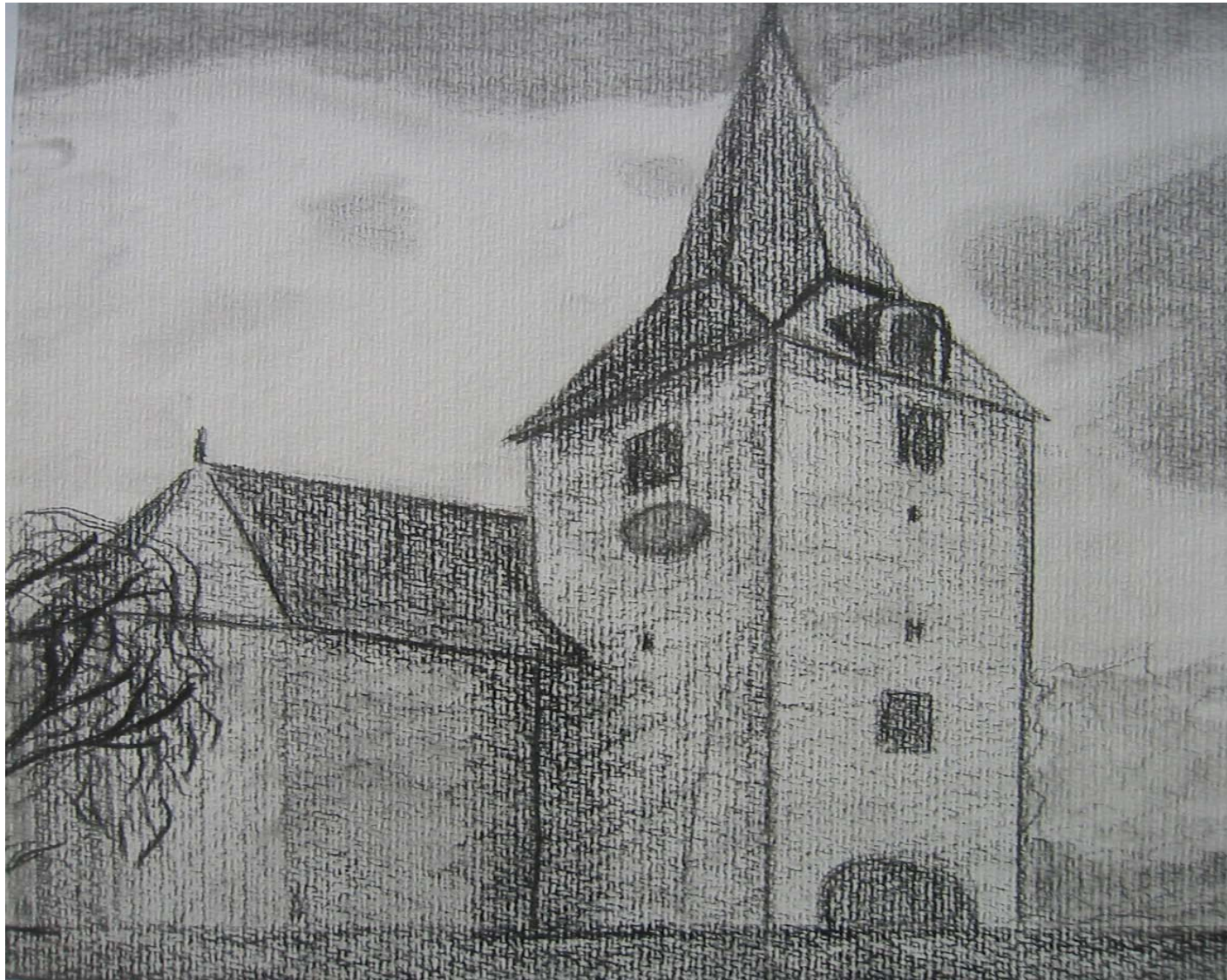
Franziska Franke Stadtkirche – Melsungen Tusche und Graphit