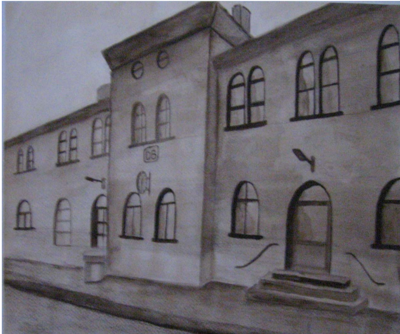
6 Franziska Franke Bahnhof Melsungen Graphit und Tusche