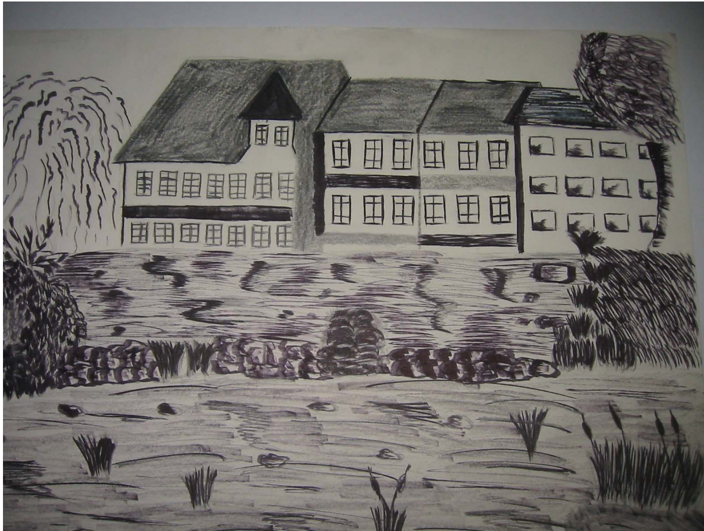
Bente Folwerk Wehr – Melsungen Tusche