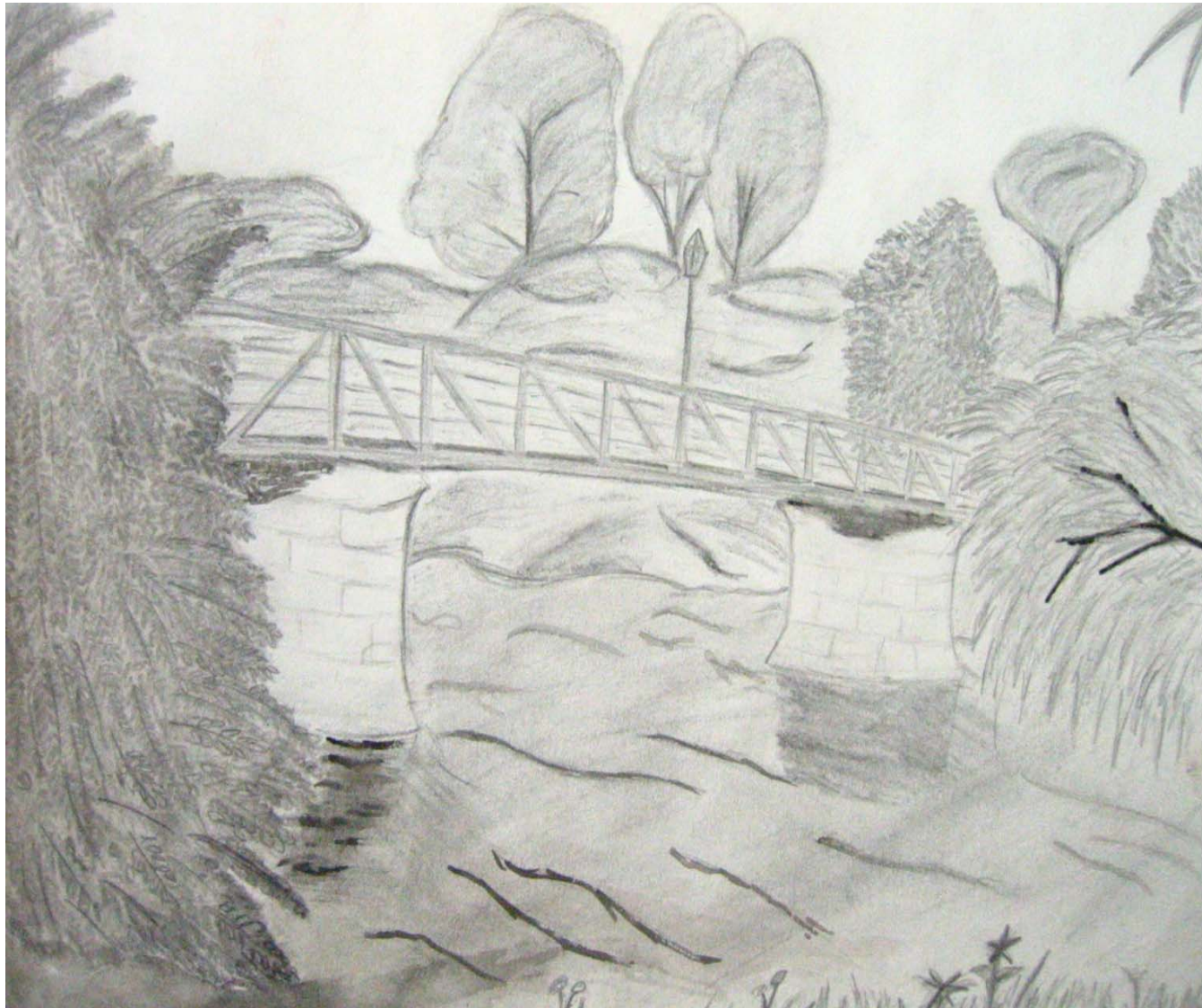
Jens Linder Zweipfennigsbrücke Graphit