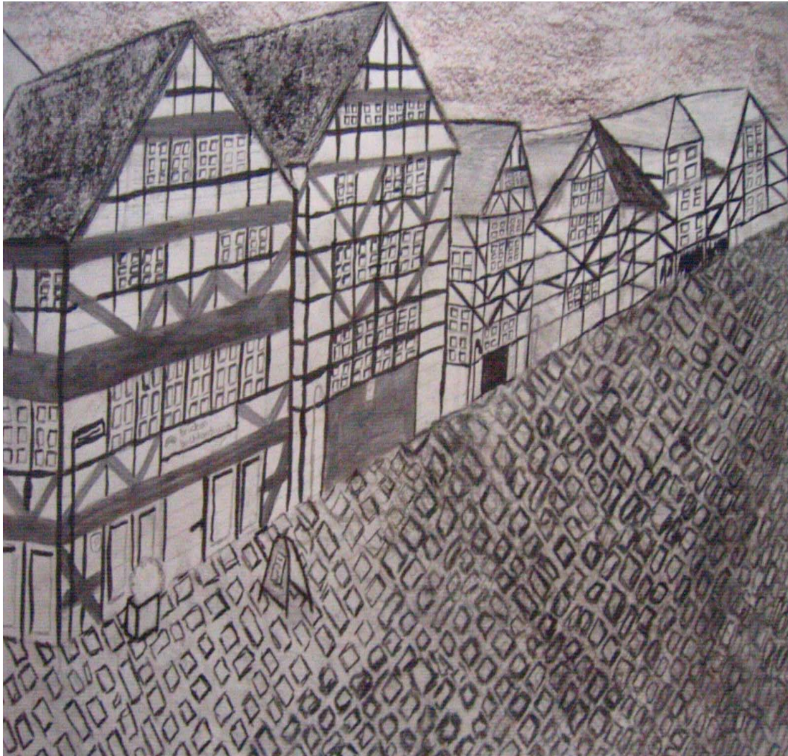
Bente Folwerk Brückenstraße – Melsungen Graphit und Tusche