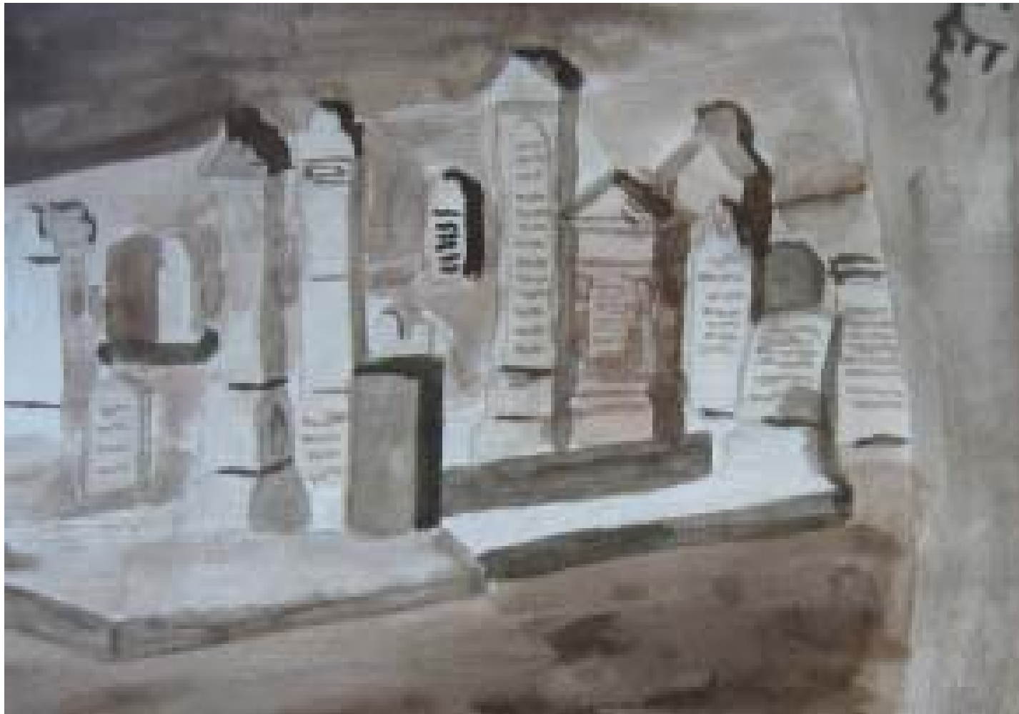
Bente Folwerk Jüdischer Friedhof in Melsungen Tusche und Graphit